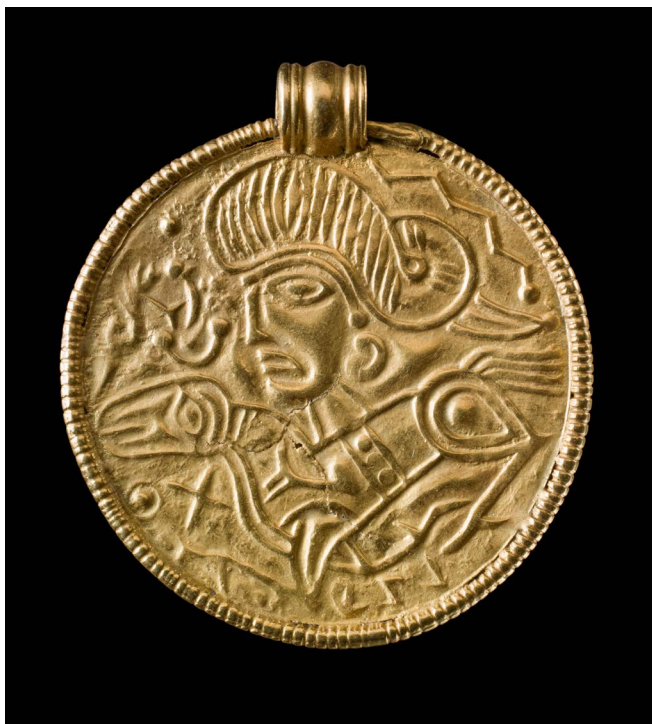
C-brakteat fra Kitnæs, 2,8 cm i diameter.