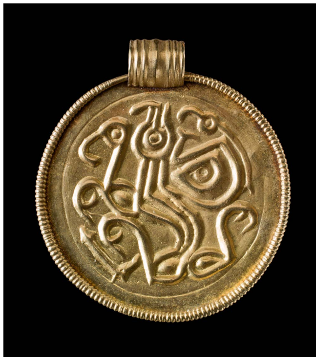
C-brakteat fra Års, 2,7 cm i diameter.