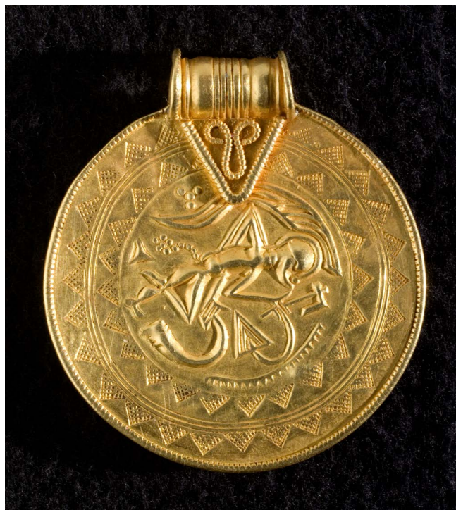
B-brakteat fra Rugbjerg, 3,7 cm i diameter.